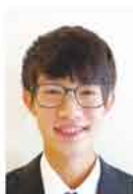
(神奈川県) ロケジョシュ 輝

■2021年9月6日、(月)午前10時より、学院の入学式が執り行われました。この日、1、2年コース、3名、牧師・リーダーコース(通称ALPSコース)、3名の、合計6名が新たに学びをスタートしました。これからの歩みの為にお祈りをよろしくお願いいたします。