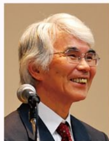
熊本県大津市、大津キリスト教会牧師・学院顧問