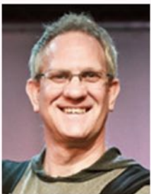
千葉県船橋市、ホープチャーチ主任牧師・卒業式ゲスト