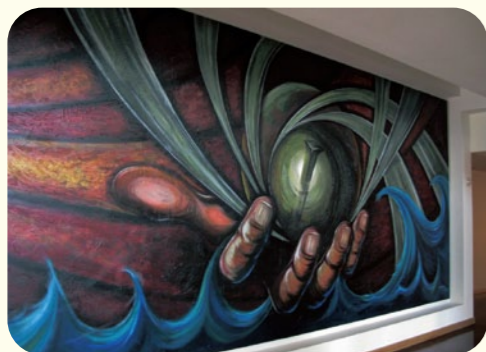
●新たに建設中の創造科学館。正面ホールの天地創造の絵