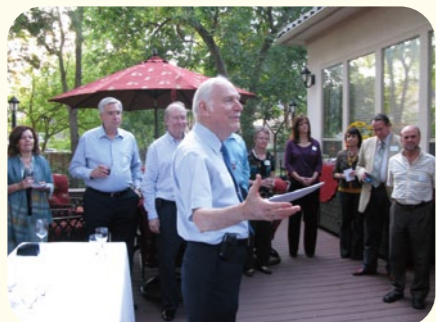
●アメリカ学院理事の皆さんとの野外会食パーティー