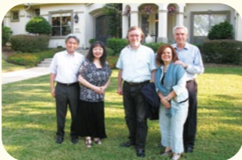
●デニス師の邸宅の前で