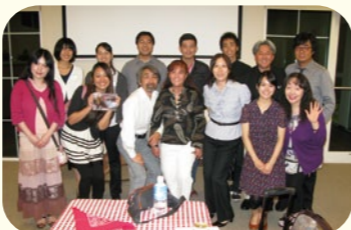
●CFNIで学んでいる日本人学生との記念写真