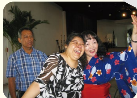
●車椅子から立ち上がり、喜ぶ教会メンバー