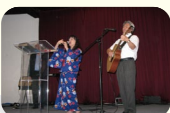
●メキシコの教会での奉仕