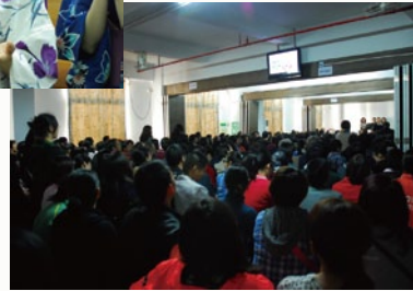
中国、家の教会の様子