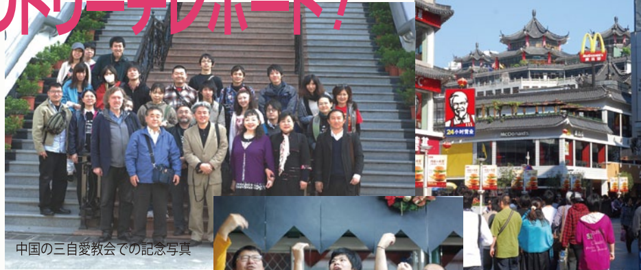
中国の三自愛教会での記念写真

ハレルヤ! 皆様からのご支援とお祈りに支えられて、昨年暮れ、無事にアウトリーチを終えることが出来ました。心より感謝いたします。全ての感謝と栄光を主にささげすると共に、以下ご報告致します。参加者全員のレポートは学院ホームページに記載していますのでご覧ください。