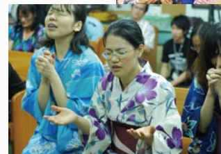
台湾、花蓮市の教会での祈り