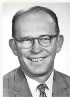
ウィラード・リビー博士 1908年～1980年、アメリカの科学者。炭素14を用いた放射性炭素年代測定法を開発した功績で1960年のノーベル化学賞を受賞。

多くの人は、放射性年代によって地球の年齢が決定されたと思い込んでいますが、実はこの年代測定法には様々な問題があることは知られていません。例えば、生物の年代測定に用いられる炭素14年代測定法は炭素14と炭素12の比率が平衡に達しているという仮定に基づいて算出されています。(炭素14年代測定法とは、炭素14と呼ばれる放射性物質に注目した年代測定法)しかしこの測定法を提唱したウィラード・リビー自身、実験結果がこの仮定と矛盾し、炭素14の産生速度が消失速度を25%上回っていることを確認していました。そしてその後研究者たちは、リビーの実験結果が誤りではなく、仮定が誤りであることを裏付けています。(*2)