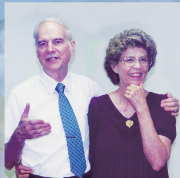
仲の良いお二人揃ってのスピーチ