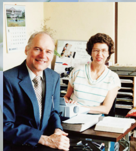
1987年当時、学院長室にて