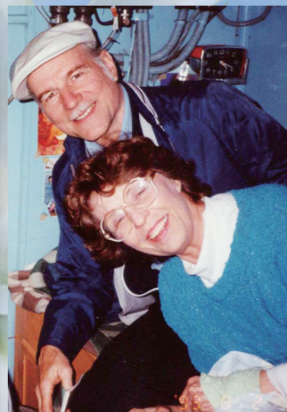
1993年、サハリンアウトリーチ（船内）