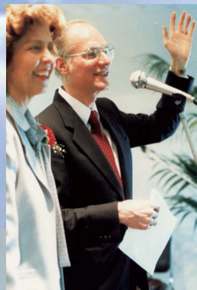
1985年、学院開校時（旧名、アジアキリスト聖書学院）